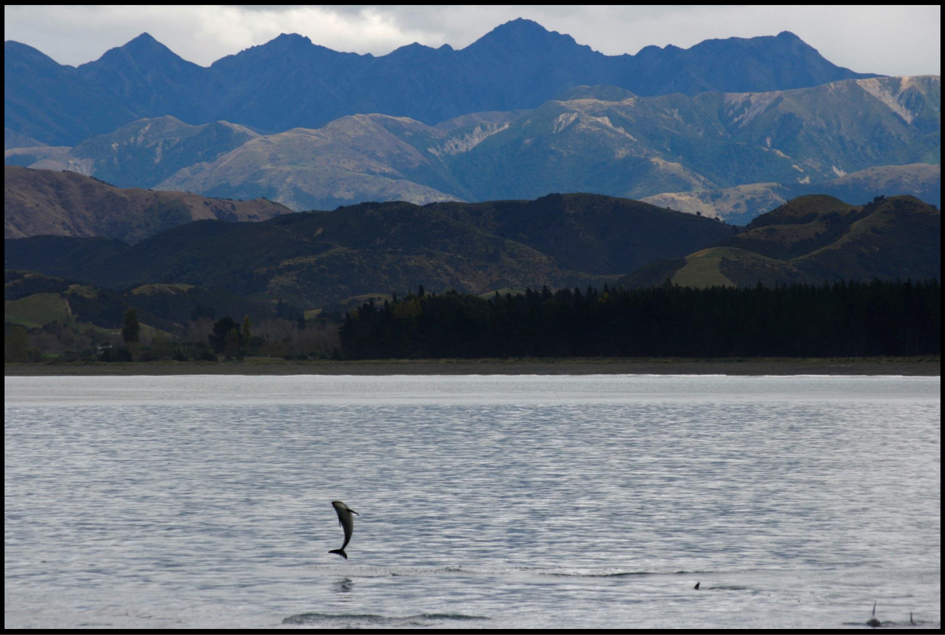
☺ Springe mutig und neugierig aus dem Wasser, bevor Du abtauchst. Es lohnt sich. ☺ Ein Schwarm Hektor-Delfine erstaunt uns mit ihren Flug- und Jagdkünsten vor der Küste von Kaikoura (Süd-Insel NZ) – April 2013